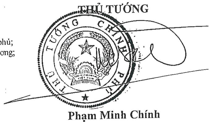
Phạm Minh Chính